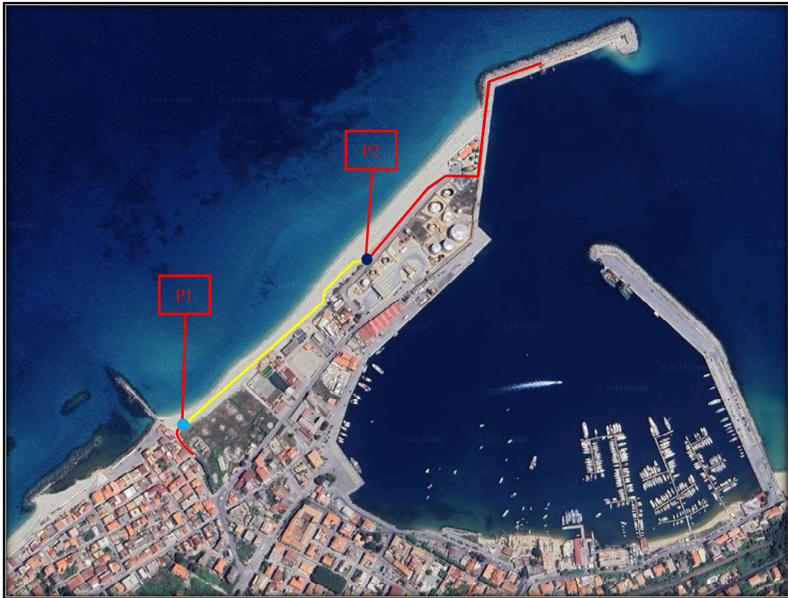
FOTO 1: ORTOFOTO CON INDICAZIONE TRATTO CON LE BEOLE DA SOSTITUIRE.